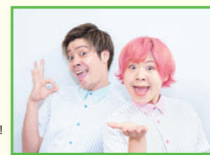
Everybody ©YOSHIMOTO KOGYO CO.,LTD.